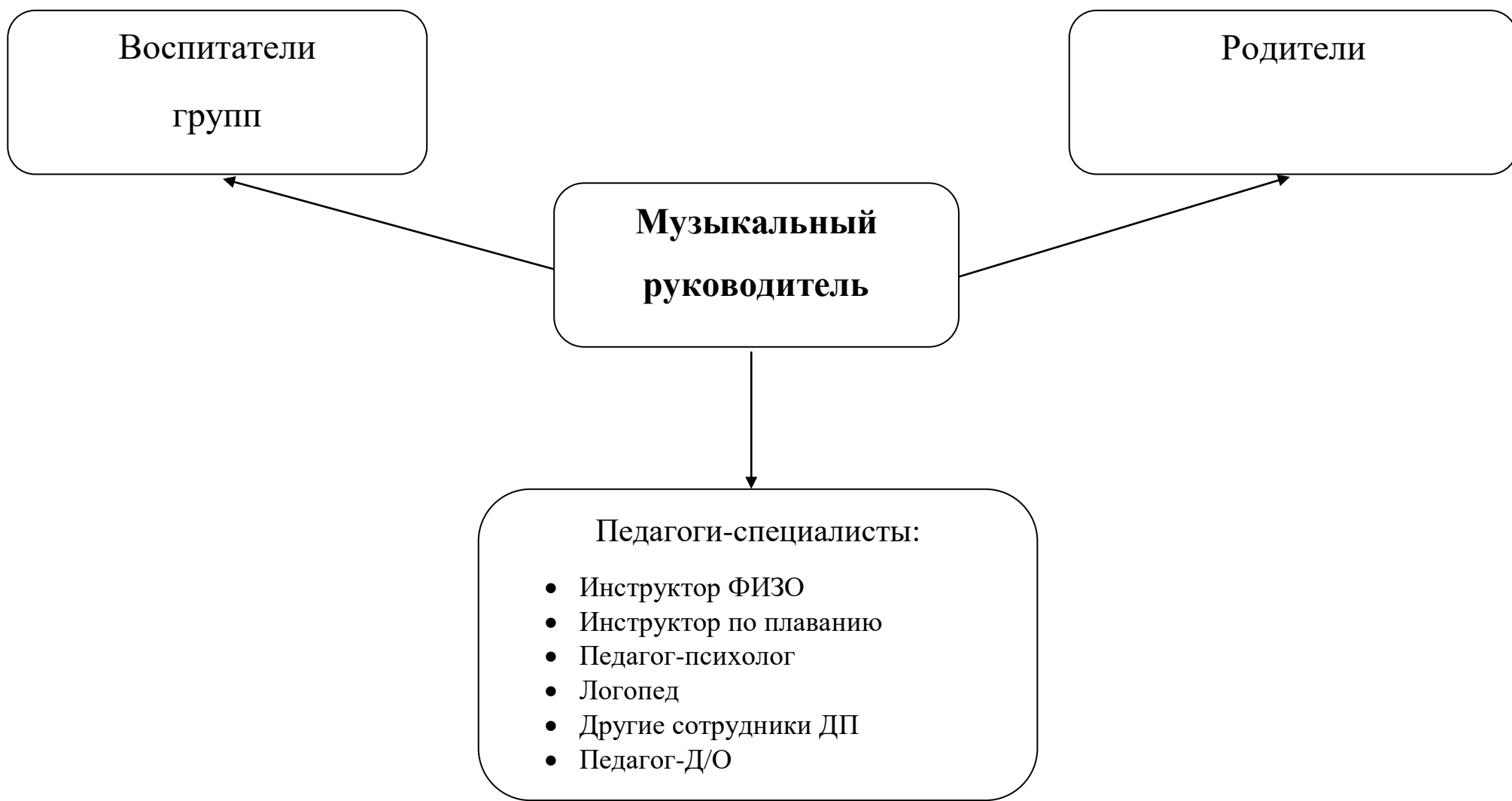
Схема организации работы по взаимодействию с другими участниками образовательного процесса